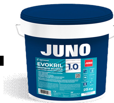
Formato: 25 kg

Las informaciones contenidas en esta ficha técnica pueden cambiar y deben ser actualizadas. Consulte www.juno.es o su representante JUNO más cercano para obtener la ficha técnica más reciente. El asesoramiento técnico de aplicación, ya sea verbal, por escrito o mediante ensayos, están basadas en la experiencia y conocimiento técnico de JUNO. Los datos mostrados en este documento deben ser considerados una recomendación y como tal no implica compromiso alguno, incluso en lo que respecta a posibles derechos de propiedad industrial de terceros. La aplicación, el empleo y la transformación de los productos suministrados por JUNO se llevan a cabo por terceros. Consecuentemente, el resultado final es responsabilidad única del cliente, aplicador o manipulador de los productos y no de la empresa suministradora. Este documento no exime al cliente de efectuar su propio examen de los productos suministrados, con objeto de verificar su idoneidad para los procedimientos y fines previstos. En caso de responsabilidad asumida por parte de JUNO, quedará ésta limitada al estricto valor de la mercancía suministrada y utilizada por el cliente, cualesquiera que fueran los daños y perjuicios ocasionados. JUNO garantiza la calidad de todos sus productos, de conformidad con las Condiciones Generales de Venta vigentes.